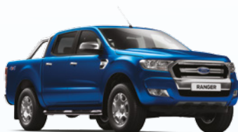
Azul Aurora |