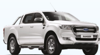
Blanco Oxford |