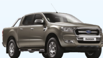
Gris Tectonic |