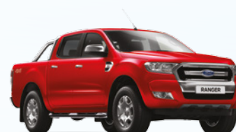
Rojo Bari |