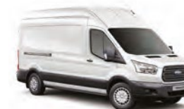
BLANCO OXFORD - 3GZ