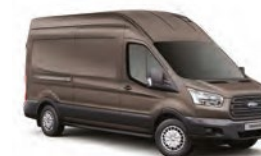
MARRÓN BRISBANE - 4AR