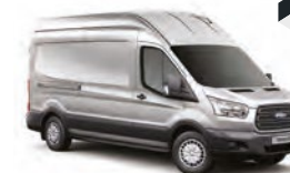
PLATA LUNAR - ZJB