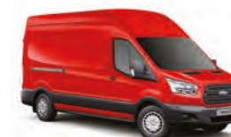
COLORADO RED - 4A7