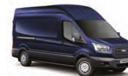
AZUL BÁLTICO - 3JV